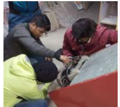
समर्थ भारत फ्रिज (Fridge Repair) रिपेयर ट्रेनिंग। Centre-7, New Ashok Nagar, East Delhi