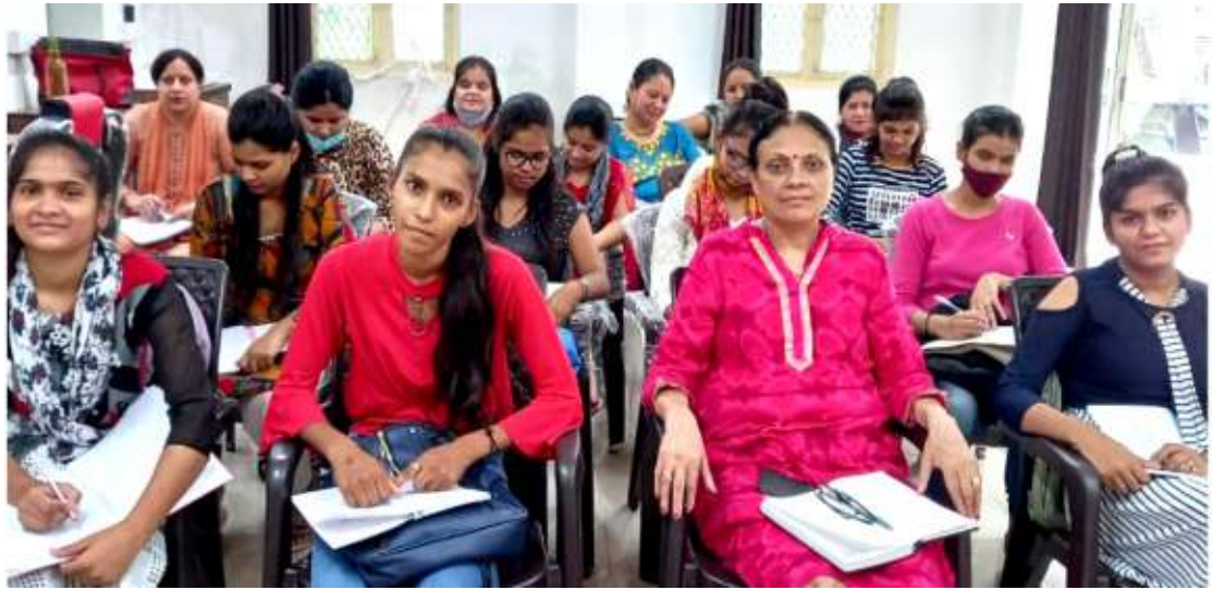
समर्थ भारत सेंटर 5 पूर्वी दिल्ली - मयूर विहार। (ब्यूटिशियन क्लास) Beautician Batch - 1