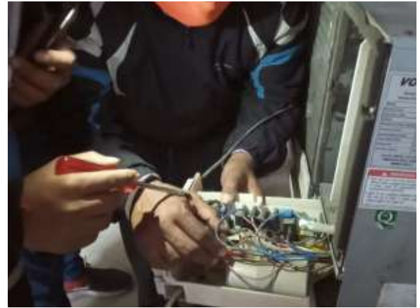
समर्थ भारत एयरकंडीशनर (Air Conditioner) रिपेयर ट्रेनिंग। Centre-7, New Ashok Nagar, East Delhi