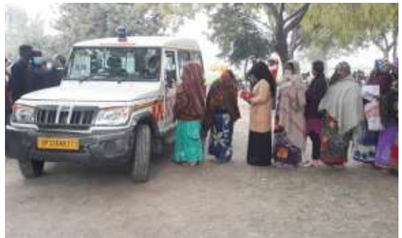
सेवा समर्पण संस्थान बिन्दौआ में अपना पंजीकरण कराते रोगी।