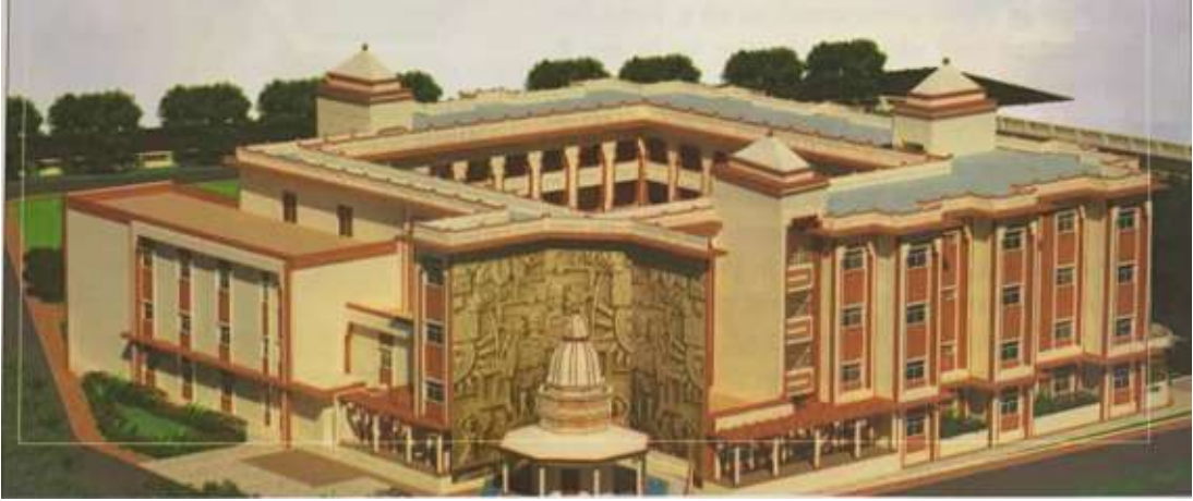
बालिकाओं के लिए बनने वाले भवन का विहंगम दृश्य

महामना शिक्षण संस्थान बालक प्रकल्प के बालकों के लिए बने भवन की तरह ही बालिकाओं के लिए बनने वाले भवन का भूमि पूजन कार्यक्रम इस वर्ष फरवरी माह में आयोजित हुआ था। अब उसके निर्माण की प्रक्रिया प्रारम्भ होने वाली है। इस भवन के निर्माण से बालिकाओं के रहने व खाने की उचित व्यवस्था हो सकेगी और उनकी पढाई भी सुनियोजित तरीके से संभव होगी जिसका उनके परिणाम पर अनुकूल असर होगा। प्रकल्प बालिकाओं के सर्वांगीण विकास को प्रेरित करने को प्रयत्नशील है।